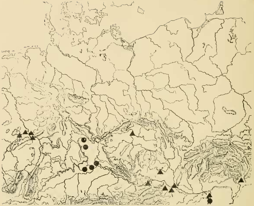
Abb. 3: Bisher nachgewiesene Fundorte in Mitteleuropa für